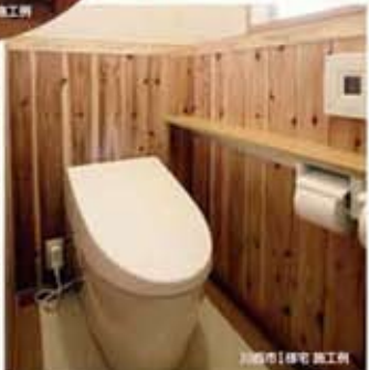
川西市B様宅 施工例