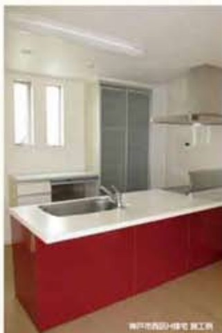
神戸市西宮区1000号 施工例