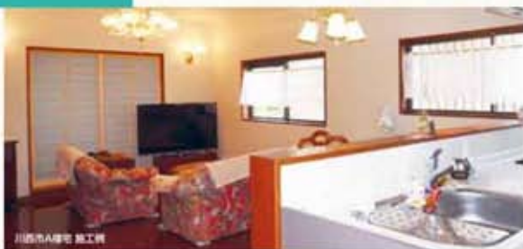
川西市A様宅 施工例