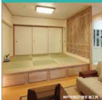
神戸市西宮区1000号 施工例

住まいのコープは組合員様の健康と自然環境に配慮したご提案をします。そして、工事をしていただいたすべての皆様へ笑顔あふれる心豊かな暮らしをお届けします。