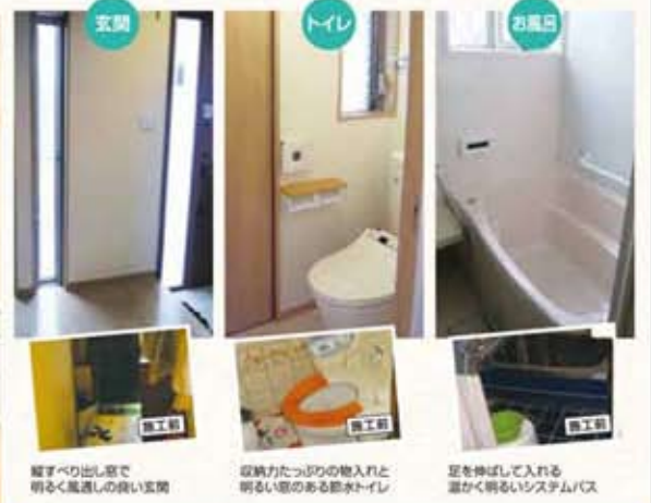
1 足すべり出し窓で明るく風通しの良い玄関 2 収納力たっぷりのお入れと明るく風通しの良いトイレ 3 足を伸ばして入れる温かく明るいシステムバス