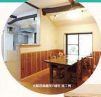
大塚町南側市1000号 施工例