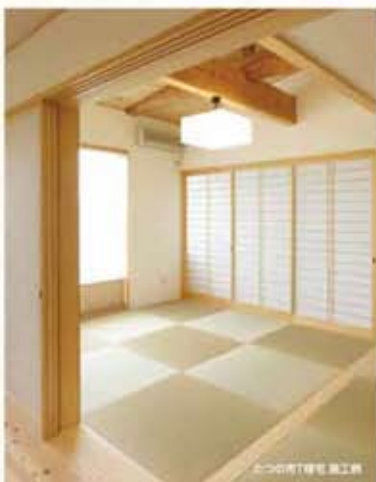
六つ川町1000号 施工例